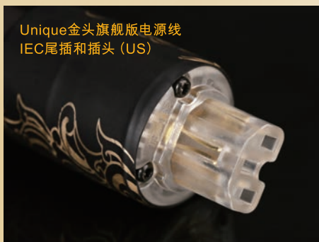
Unique金头旗舰版电源线 IEC尾插和插头 (US)

而关于Unique金线的声音取向上，林先生表示，Unique金线线材导体尽管具备金/银成份，但声